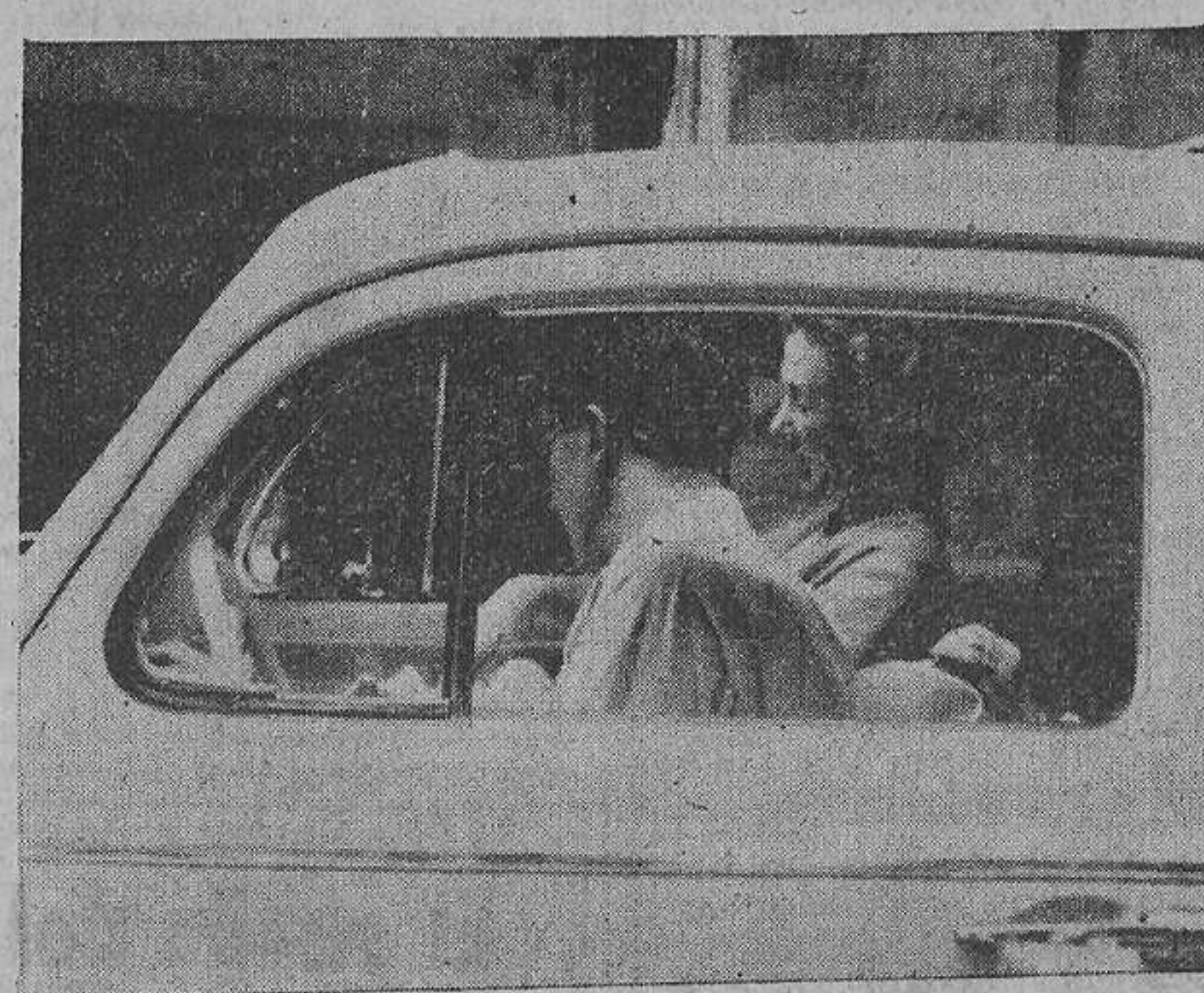
Los reyes de Bélgica completan estos días sus vacaciones en España con una serie de excursiones en automóvil por los alrededores de su residencia. En la foto, vemos al monarca al volante, acompañado de su regia esposa en una de sus giras.